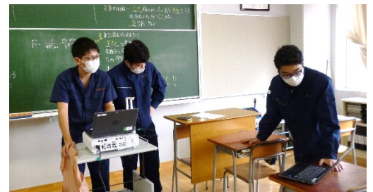
ICT委員会：リモート授業接続テストの様子

出席停止の場合は朝、必ず保護者が学校に連絡してください。判断に迷ったときはご連絡ください。