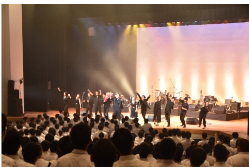
ゴスペルコンサートを鑑賞しました。