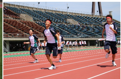
1年生クラス対抗リレー