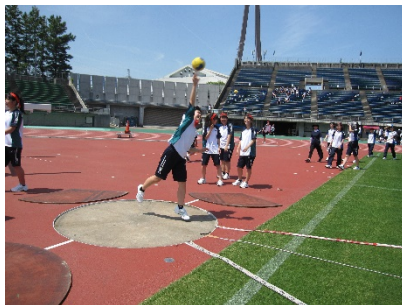
ハンドボール投げ

午前中はスポーツテストで自己記録更新、午後は運動競技会でクラス・科の団結を深めました。