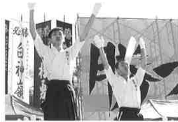
高校相撲金沢大会