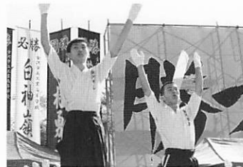
高校相撲金沢大会